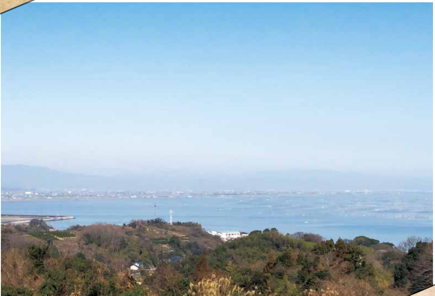
「海道しるべから望む有明海」