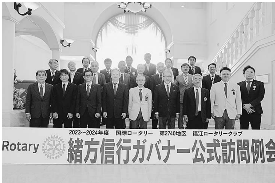
緒方信行ガバナー公式訪問例会 2023年 8 月 4 日